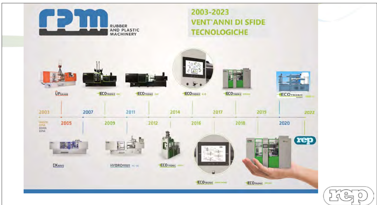
L'evoluzione della gamma di presse RPM dal 2003 a oggi.

REP si avvantaggia così della competenza di un leader tecnologico nelle presse orizzontali e RPM della rete internazionale REP.