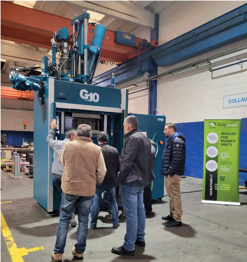
Un gruppo di clienti di fronte alla G10, ultima generazione delle presse verticali di REP.

Un occhio di riguardo è riservato anche al servizio post vendita: sono 25 i centri internazionali di assistenza tecnica, con 50 tecnici, che garantiscono il supporto quotidiano ai clienti. Il 95% dei pezzi viene spedito entro i tempi previsti, di cui l'85% il giorno stesso dell'ordine (per ordini trasmessi entro le 10 del mattino).