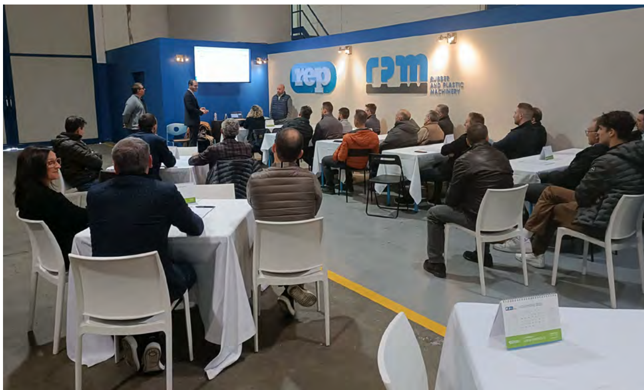
Un momento della presentazione del 10 novembre.

aziende è pienamente operativa, il 10 e 11 novembre è stata organizzata una Open House della durata di un giorno e mezzo alla quale hanno invitato i clienti per mostrare loro le ultime novità relative all'offerta di presse, che include macchine sia orizzontali che verticali.