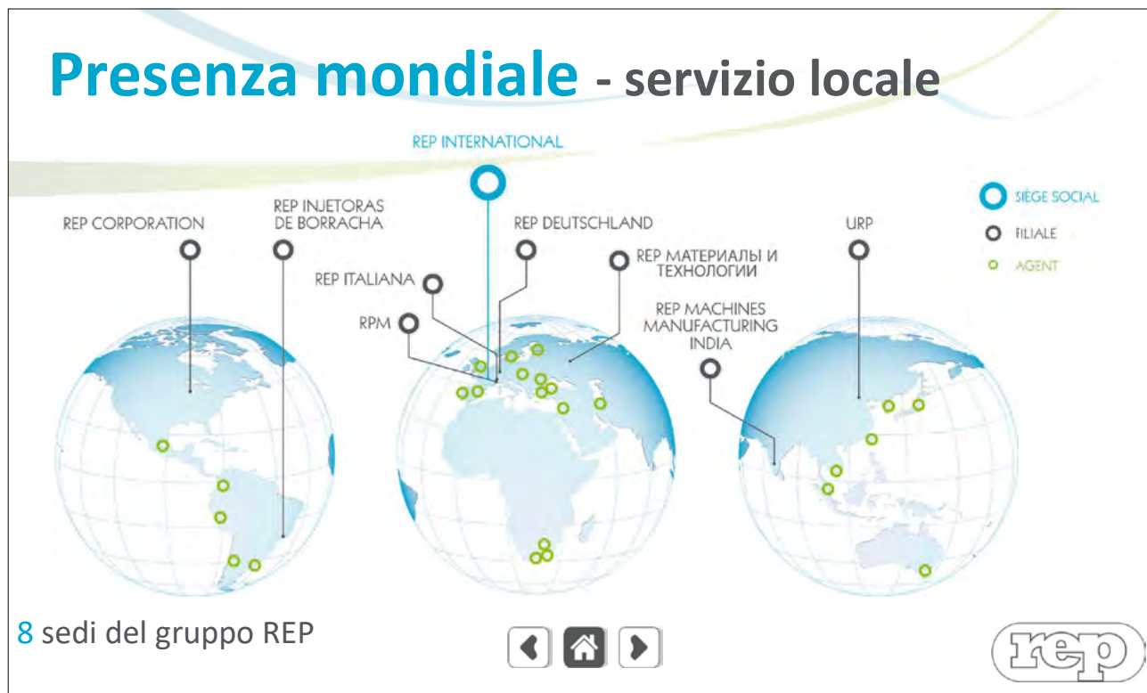
La suddivisione delle sedi del gruppo REP nel mondo.